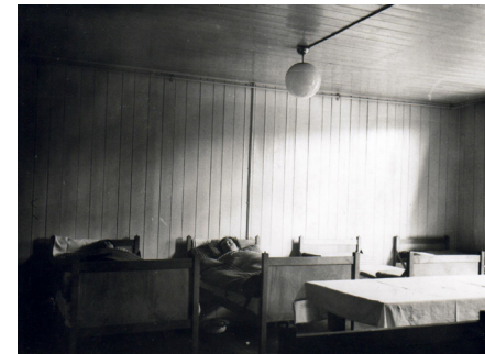
Krankenrevier, SS-Foto, 1941